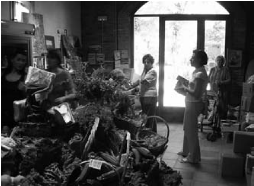
Imatge 17. L'agrobotiga de Gallecs, un dels establiments comercials en què s'està posant en marxa l'estratègia del contacte directe entre el productor agrari vallesà i el consumidor.

d'observació i gaudi, es fa una distinció entre els perimetrals a la plana, d'una banda, i els punts que —des de dins de la plana— possibiliten albirar-ne determinats fragments, de l'altra.