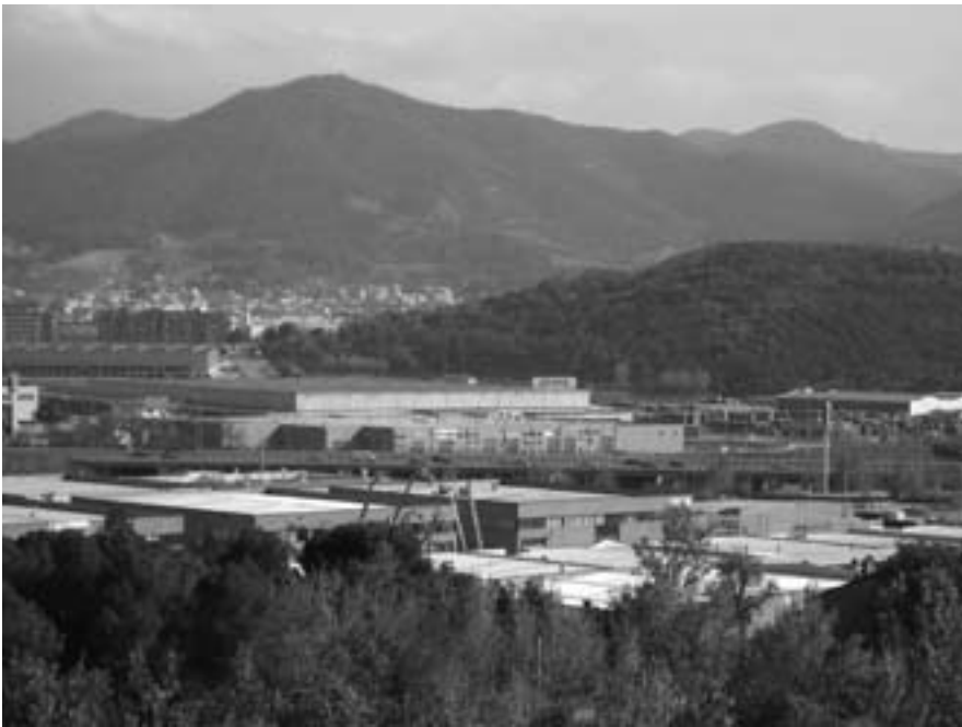
Imatge 19. L'element urbanitzat protagonitza la Plana del Vallès i és de preveure que adquireixi més importància els propers anys, sobretot afectant espais agraris.