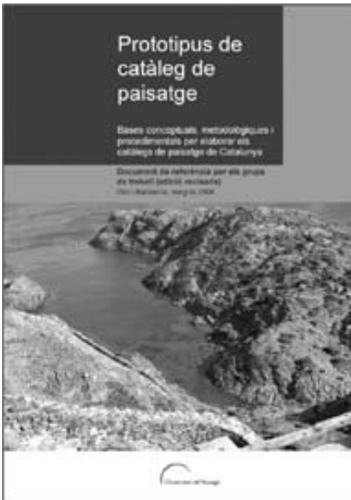
Imatge 4. Prototipus de catàleg de paisatge.

Aquests dubtes, sumats al caràcter innovador de l'eina i a la seva transcendència en la planificació territorial a Catalunya, van impulsar l'Observatori del Paisatge a preparar un prototipus de catàleg de paisatge 6 que estableix un marc comú de treball per elaborar els set catàlegs de paisatge d'una forma coherent i coordinada. Aquest document, confegit d'una manera semblant a les guidelines d'origen anglosaxó, va ser posat a la consideració de més de setanta institucions, grups de recerca i experts en paisatge per tal d'obtenir el màxim consens sobre els continguts. 7 La seva versió definitiva, de Nogué i Sala (2006), és del mes de maig d'aquell any.