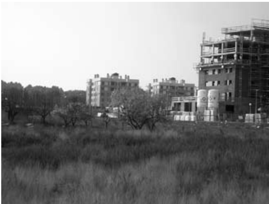
Imatge 1. Al Vallès, com arreu de Catalunya, l'expansió de la taca urbana ha estat intensa les darreres dècades. A la imatge, les noves edificacions de Sabadell ocupen antics camps de secà, abandonats però encara amb uns ametllers condemnats.