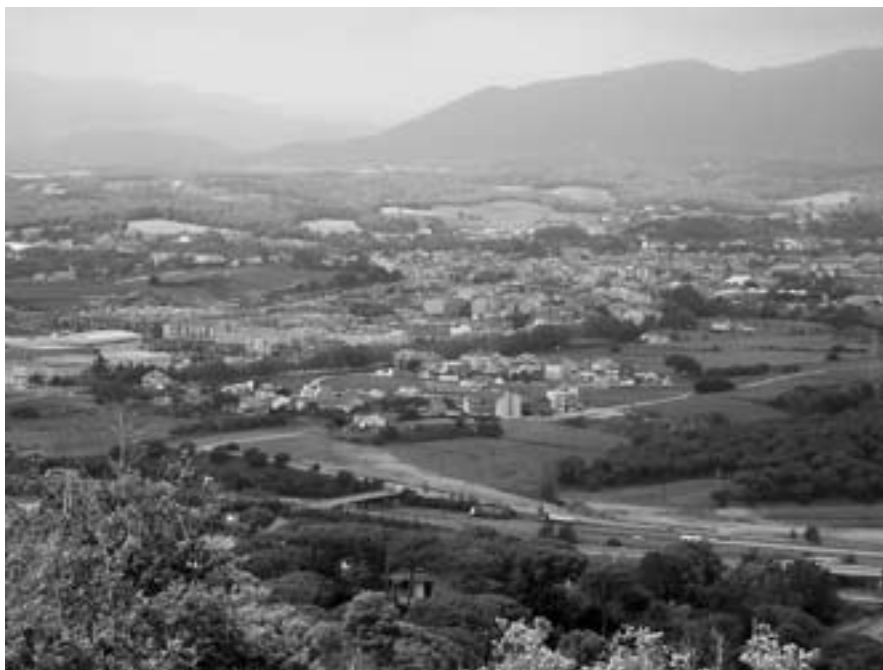
Imatge 14. Cardedeu, una de les principals localitats del Vallès més oriental. A diferència d'altres poblacions de la comarca, manté una aparença de nucli compacte i no ha format creixements continus amb localitats properes que hagin donat lloc a coalescència de trames urbanes contigües.