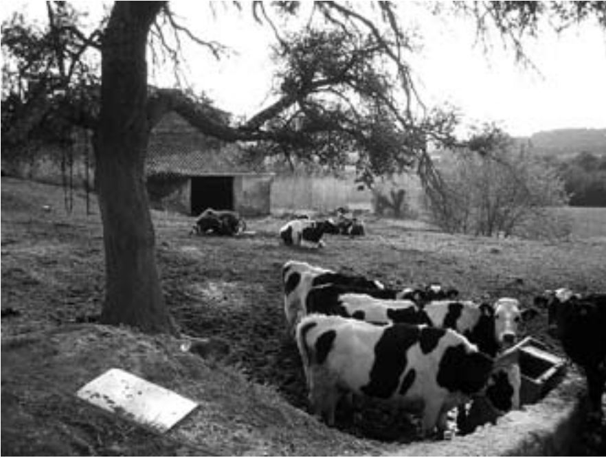
Imatge 15. Nombroses explotacions agràries de la Plana del Vallès, en especial al cantó més oriental, segueixen estant orientades a la ramaderia bovina per a la producció de llet, una orientació que prové de l'inici del segle XX i que té a veure amb la inserció plena de l'agricultura vallesana en el mercat barceloní (així com en l'extensió del consum de llet a les ciutats, que es produeix precisament en aquell moment). A la imatge, vaques frisones a les Franqueses del Vallès.