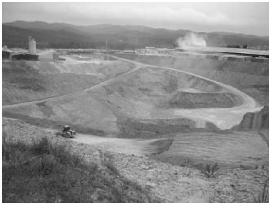
Imatge 18. Un dels indrets més coneguts de la Plana del Vallès que es troben en una situació degradada: l'extracció d'àrids, encara en funcionament, a la plana del Castell de Sant Marçal (Cerdanyola del Vallès), situada al bell mig de la via verda Sant Llorenç-Collserola.

A mitjà termini, la taca urbana arribarà a ser predominant a la plana vallesana, no només lleugerament per sobre del recobriment superficial dels espais agraris (com s'esdevé avui dia), sinó sobrepasant-los àmpliament. La previsió és, per tant, que els espais oberts es vagin reduint progressivament i la urbanització hi avanci. En definitiva, el paisatge identitari del Vallès, el dels espais oberts —principalment els de dominància agrària i rural—, no té unes perspectives gens falagueres.