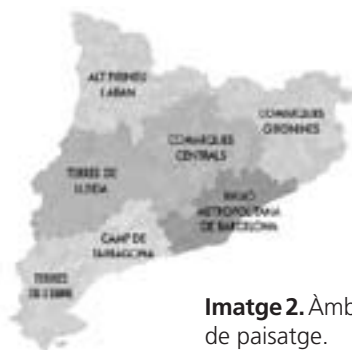
Imatge 2. Àmbit d'aplicació dels catàlegs de paisatge.

es correspon amb el de cadascun dels set àmbits d'aplicació dels plans territorials parcials segons la legislació catalana (lleis 1/1995 i 24/2001): Alt Pirineu i Aran, Comarques Centrals, Camp de Tarragona, Terres de Lleida, Regió Metropolitana de Barcelona, Comarques Gironines i Terres de l'Ebre. Mentre el Parlament no es pronunciï en una direcció diferent, els set àmbits vigents són el marc de referència de la política de paisatge.