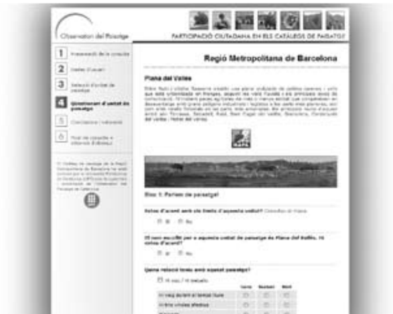
Imatge 3. Mostra de part de la consulta del Catàleg de paisatge de la Regió Metropolitana de Barcelona utilitzant el web de l'Observatori del Paisatge.