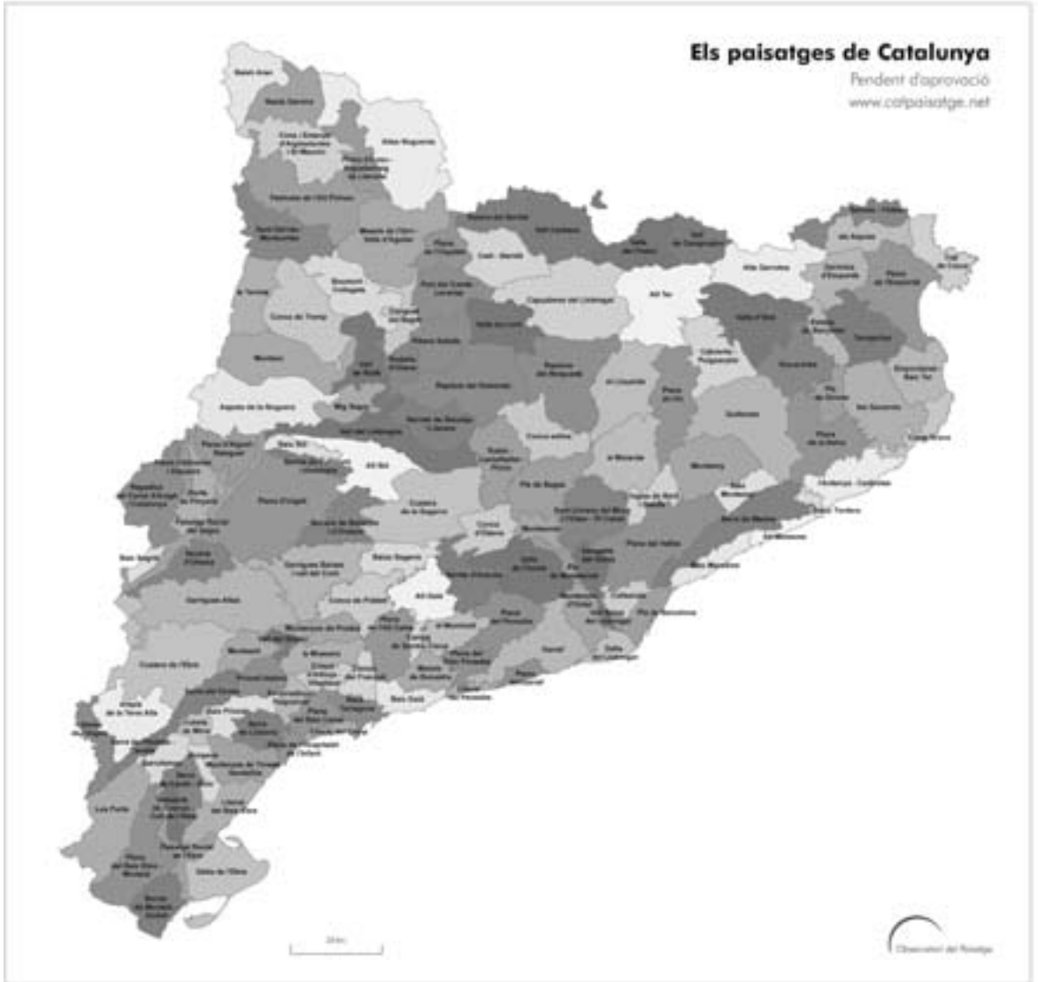
Imatge 5. Mapa de les unitats de paisatge de Catalunya (pendent d'aprovació).

perquè les ciutats i les seves perifèries, els mosaics agroforestals, la vegetació, l'arquitectura, els noms de cada lloc, les olors, els sons, el tacte o altres impressions sensorials configuren paisatges que són característics de cada indret –i d'enlloc més.