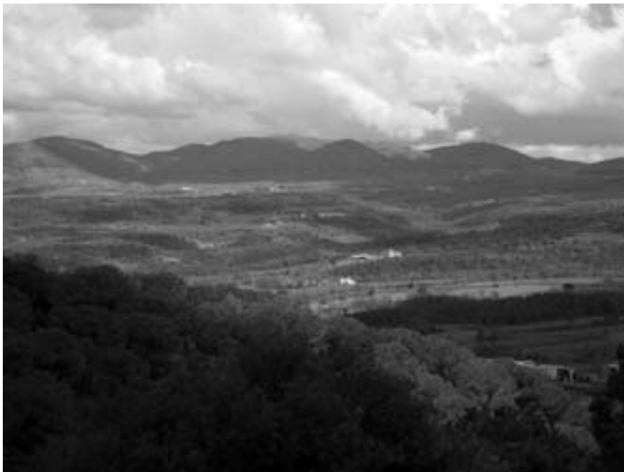
Imatge 12. Panoràmica de l'altiplà del Moianès des de la rodalia de Castellterçol: zona planera elevada, protagonitzada per la convivència dels camps de conreu amb les bosquíries, que s'insereix ja dins de la Depressió Central.

conreus herbacis i alguna urbanització. Aquesta definició es feia pensant no només en el sector vallesà, sinó sobretot en el sector contigu que el Catàleg de paisatge de les Comarques Centrals ha de treballar per la seva banda. Va plantejar força dubtes la delimitació del Moianès amb la resta de les unitats metropolitanes, però com en les altres ocasions, es va optar per una tria operativa basada en atributs de tipus topogràfic i de cobertures del sòl, tria que es va concretar mitjançant treball de camp.